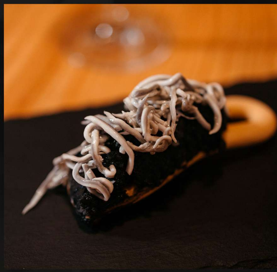
*marinera negra con gulas al ajillo