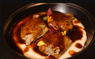
*Raviolis de rabo de toro