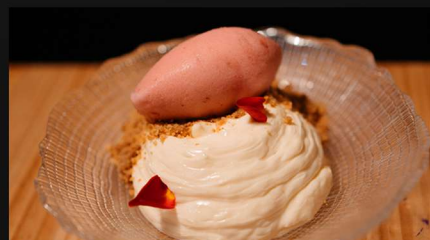
*Tarta de queso